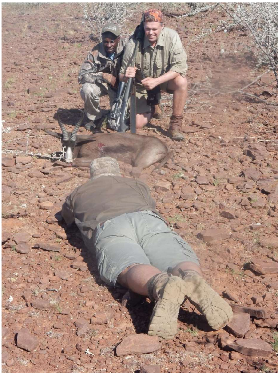
Troféfotografering av Black Springbuck

Alla kostnader uträknande efter valutakurs 240130, reservation avseende ev. förändringar tills bokning/slutbetalning har ägt rum.