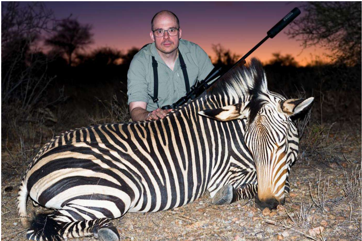
Hartmanns zebra/Mountain zebra (cites krävs)